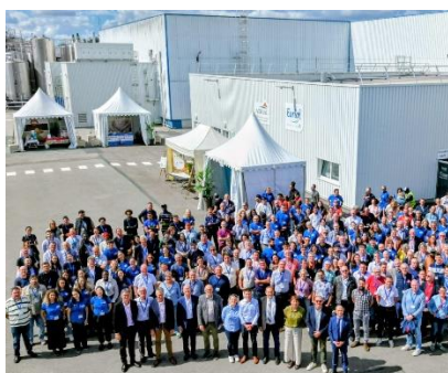
Laiterie rénovée de Belleville-sur-Vie (85)