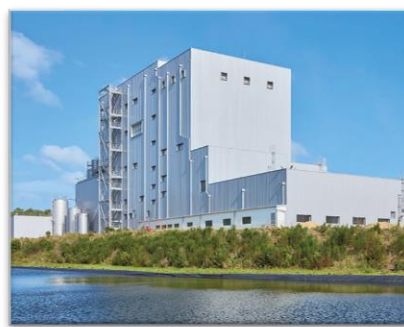
Tour 3 du site laitier d'Herbignac (44)